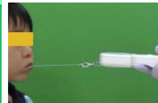
「小児の口腔機能発達評価マニュアル」 (日本歯科医学会)