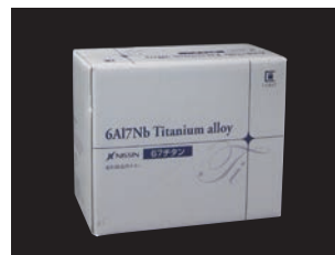
6Al7Nbチタン合金 (全2サイズ)