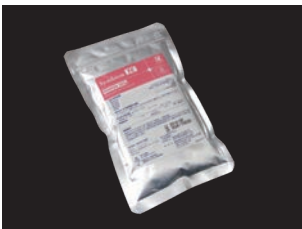
シンビオン-TC (クラウンブリッジ用) 粉200g/袋 (25袋入り 5kg)