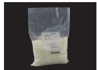
コーティングワックス