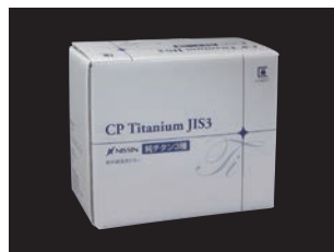
純チタン 3種 (全2サイズ)