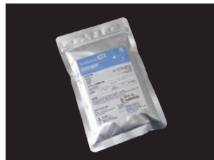
シンビオン-TM (耐火模型専用) 粉180g (1床分)/袋 (20袋入り 3.6kg)