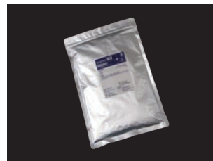
シンビオン-TD (外埋没材用) 粉700g (1床分)/袋 (10袋入り 7kg)