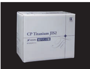
純チタン 2種 (全5サイズ)